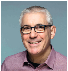
Uwe Happel Watzenborn-Steinberg

Der neugewählte Bürgermeister, Andreas Ruck, bekommt unsere Unterstützung, um Pohlheim in eine sichere Zukunft zu führen. Dabei arbeiten wir vertrauensvoll mit Bündnis 90/Die Grünen und FDP zusammen, suchen aber auch den Austausch mit CDU und FW.