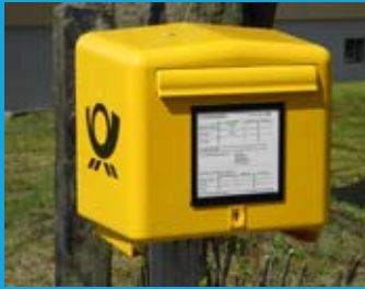
Die kleinste Wahlkabine der Welt

Dazu können Sie das Formular auf der Rückseite Ihrer Wahlbenachrichtigung ausfüllen und abschieken. Sollte Ihnen diese nicht bis 15. Februar 2016 zugeschickt werden, fragen Sie bei Ihrem Wahlamt nach.