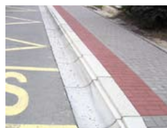
Sog. Kasseler Borde