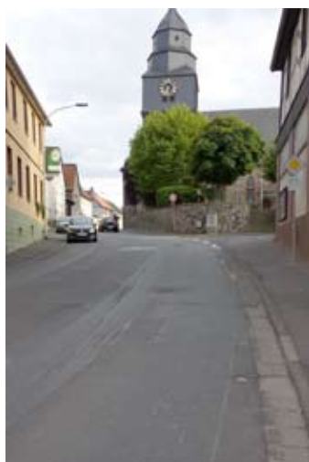
Ortsdurchfahrt durch Grüningen

Eine Autofahrt durch Grüningen ohne gute Federung sei niemandem empfohlen. Steinberger Straße und Taunusstraße präsentieren sich schon seit Jahren in einem desolaten Zustand. Die Straßendecke ist ein einziger Flickenteppich, Bürgersteige an