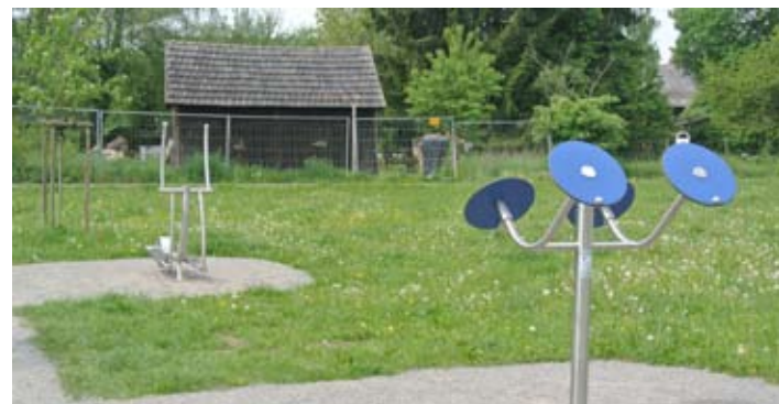
Neue Geräte im Tergarten Garbenteich

tiere und die beiden Sportgeräte hat der „Tergarten“ nun eine deutliche Aufwertung erfahren und lädt die ganze Familie, Senioren und Kinder zum Verweilen ein. Genau das richtige Ziel für einen Spaziergang zum Jahresanfang!